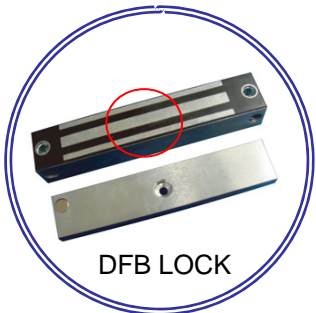
DFB LOCK 防水型電気錠