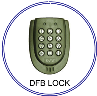
DFB LOCK 非接触カードリーダー